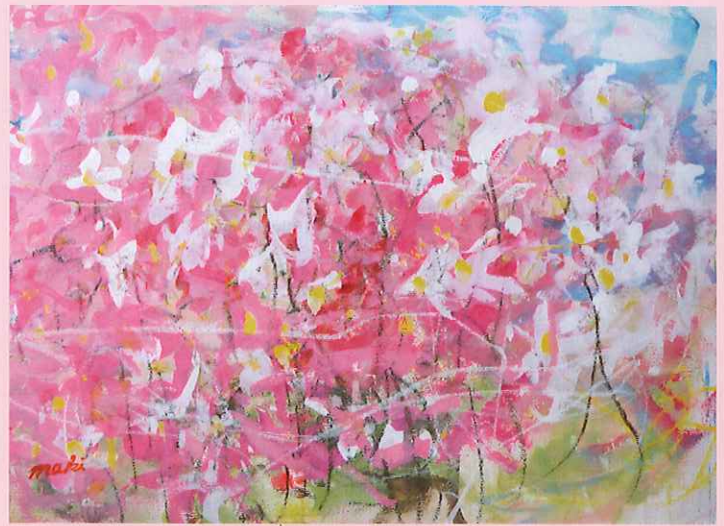
きらめくコスモス/山田真己(絵画)

咲き誇る花、作品の中にイメージされた花にまつわる風景。短冊などに綴った文字による花の物語を感じてください。