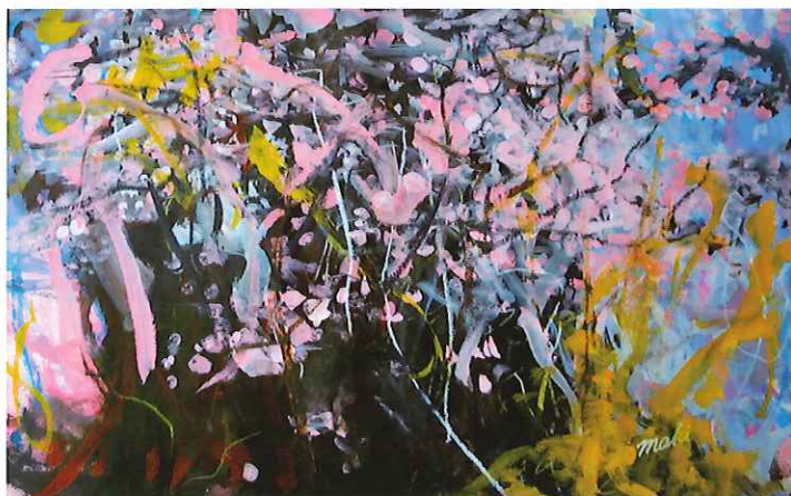
いのちの限り / 山田真己